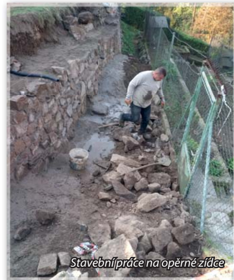
Stavební práce na opěrné zídce

Během října a listopadu byla provedena oprava havarijního stavu opěrné zdi u č.p. 40. Po rozebrání dosavadní zdi byla vybudována nová zeď z původního kamene, která je nyní stavebně provázána s kamenným podložím kvůli zlepšení statických vlastností zdi.