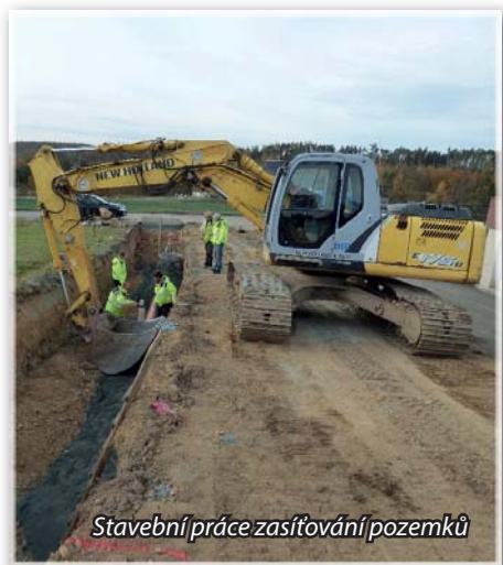
Stavební práce zasítování pozemků

Na obecních pozemcích v lokalitě „U borovice“ byla v červnu tohoto roku dokončena výstavba místní komunikace s chodníkem a uložení všech potřebných inženýrských sítí (vodovod, kanalizace, splašková i dešťová, plynovod, elektrina, veřejné osvětlení). V lokalitě vzniklo celkem 7 parcel pro výstavbu rodinných domů určených k prodeji. V druhé polovině letošního roku proběhl prodej těchto parcel, ke kterému podalo žádost o koupi celkem 5 zájemců. Zbývající parcely budou zájemcům nabídnuty v následujícím roce.