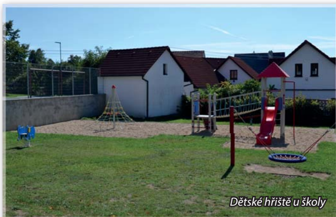
Dětské hřiště u školy