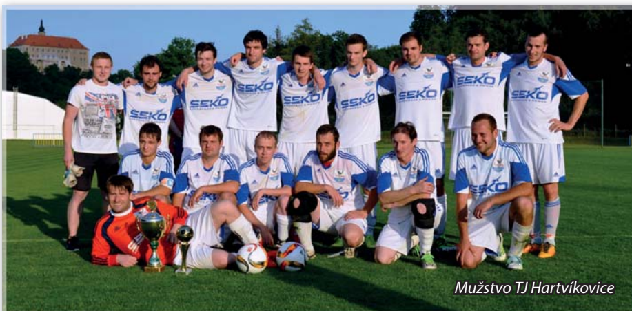
Mužstvo TJ Hartvíkovice

Po celý průběh uplynulého ročníku jsme se drželi na čele tabulky, až jsme ho nakonec zakončili na povedeném čtvrtém místě. Díky situaci v dalších okresních a krajských soutěžích to bylo místo postupové. Postup do I. B třídy jsme však odmítli.