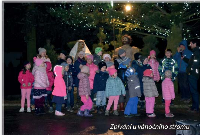
Zpívání u vánočního stromu