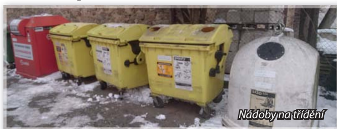
Nádoby na třídění