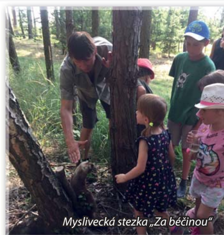
Myslivecká stezka „Za běčinou“

Máme radost z hojné účasti místních obyvatel, ať už jsou majiteli pozemků, na kterých myslivecky hospodaříme či nikoli, na našem už tradičním letním „Mysliveckém kotlíku pro sousedy a přátele myslivosti“ na louce „Běčina“ u Popůvek. Dá nám každý rok docela dost práce zajistit a rozmístit preparáty na myslivecké stezce