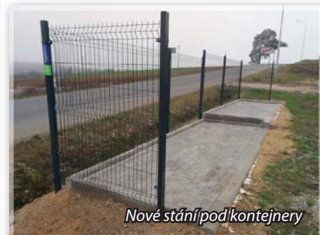
Nové stání pod kontejnery

Jednalo se o realizaci celkem 5 stání tvořených zámkovou dlažbou pro hnízda kontejnerů včetně oplocení typu NYLOFOR 3D v celé šířce hnízda. Akce byla podpořena spolufinancováním Kraje Vysočina.