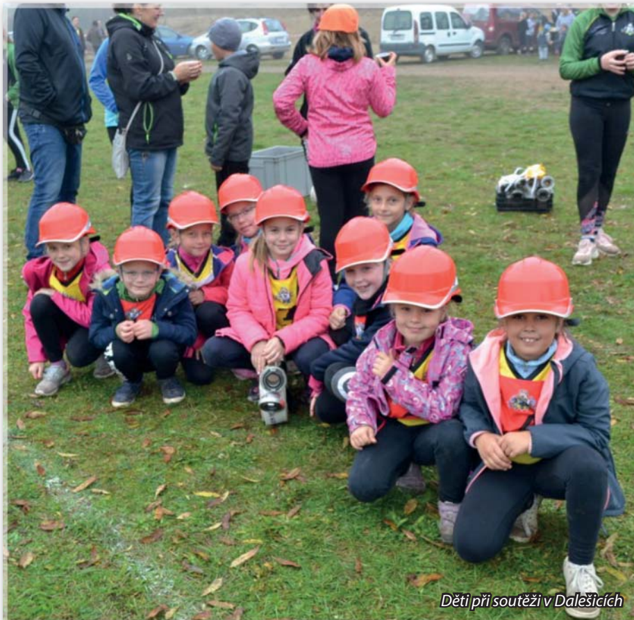
Děti při soutěži v Dalešicích