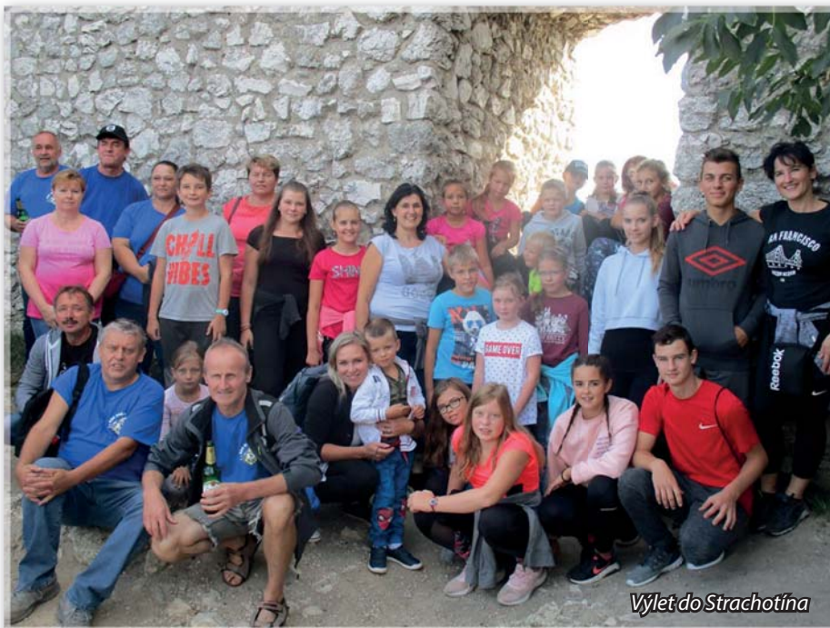
Výlet do Strachotína

Dne 19. října v Dalešicích proběhl závod požárnické všestrannosti, ve kterém se starší žáci umístili na 19. místě z 25 a mladší žáci skončili na 6. místě