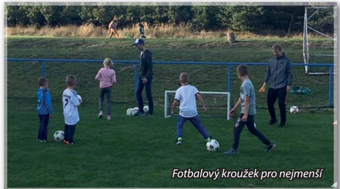
Fotbalový kroužek pro nejmenší