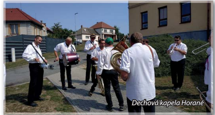
Dechová kapela Horané