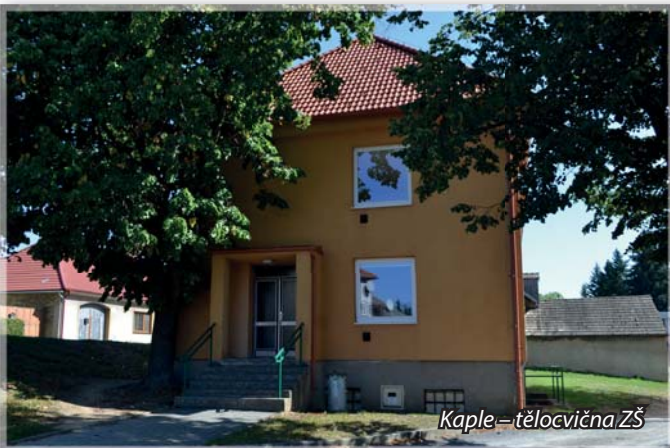
Kaple - tělocvična ZŠ