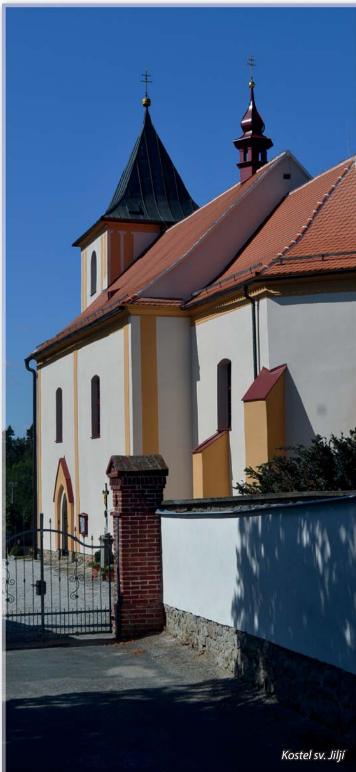
Kostel sv. Jiljí