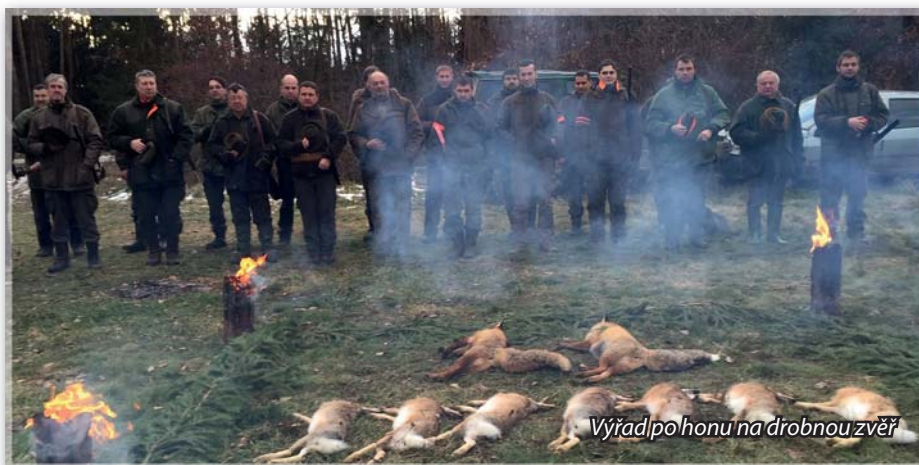
Výřad po honu na drobnou zvěř

Ze střelené zvěře nevytéká krev ale „barva“, zvěř nás nepozoruje očima ale „světly“, nestojí na nohou ale na „běžích“ či „stojácích“... I jen přeřeknutí se u myslivců trestá, ovšem přátelsky a zábavně. Myslivecká mluva vznikla již ve středověku